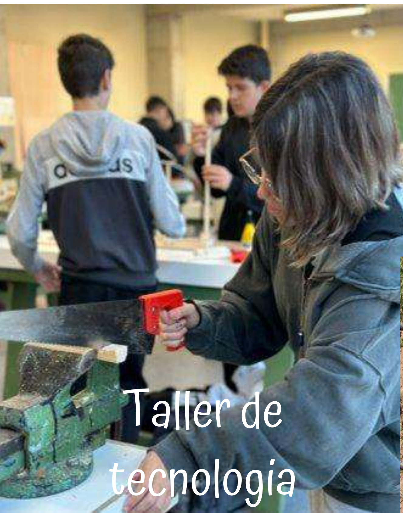
Taller de tecnologia