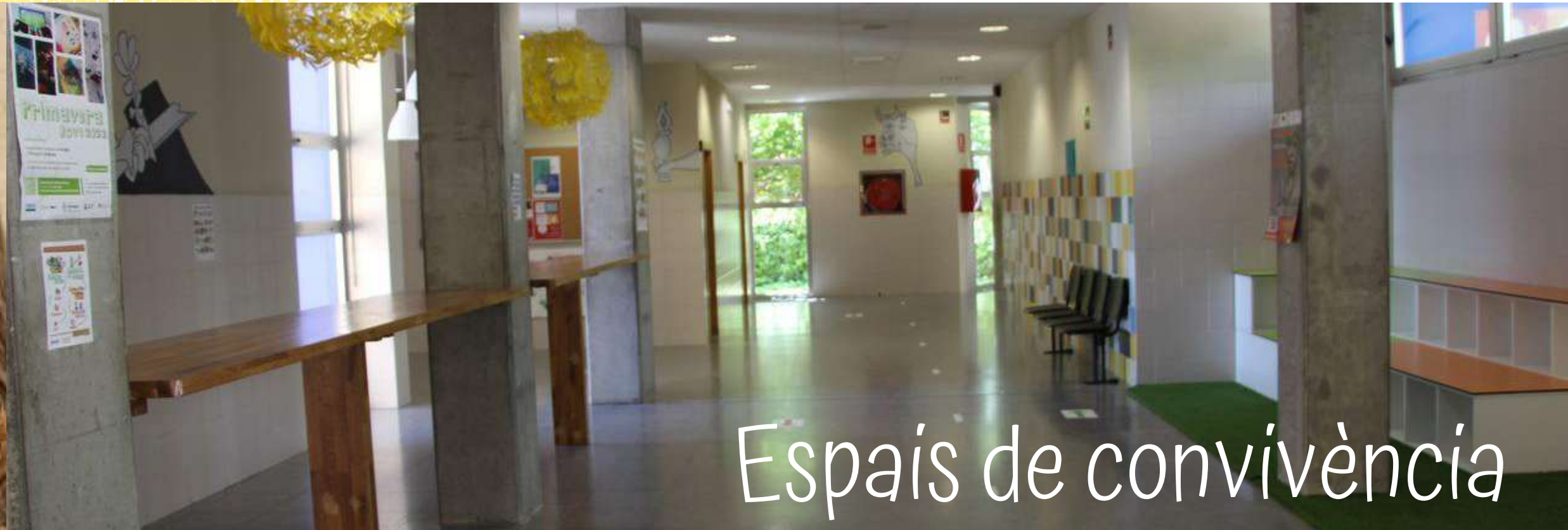
Espais de convivència